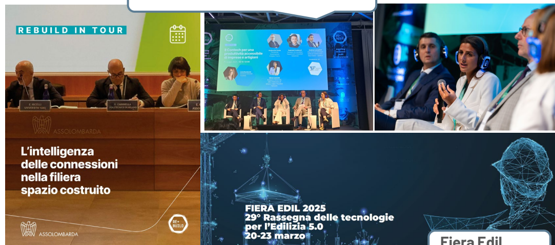
Fiera Edil Bergamo