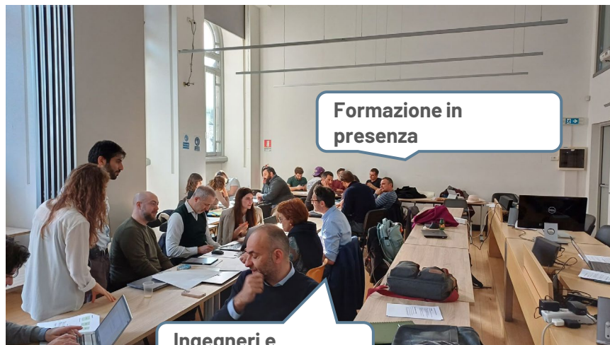
Formazione in presenza