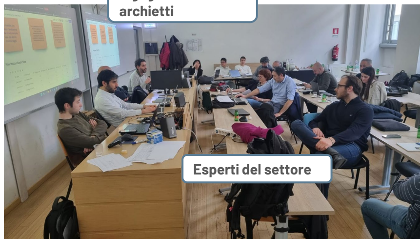
Esperti del settore